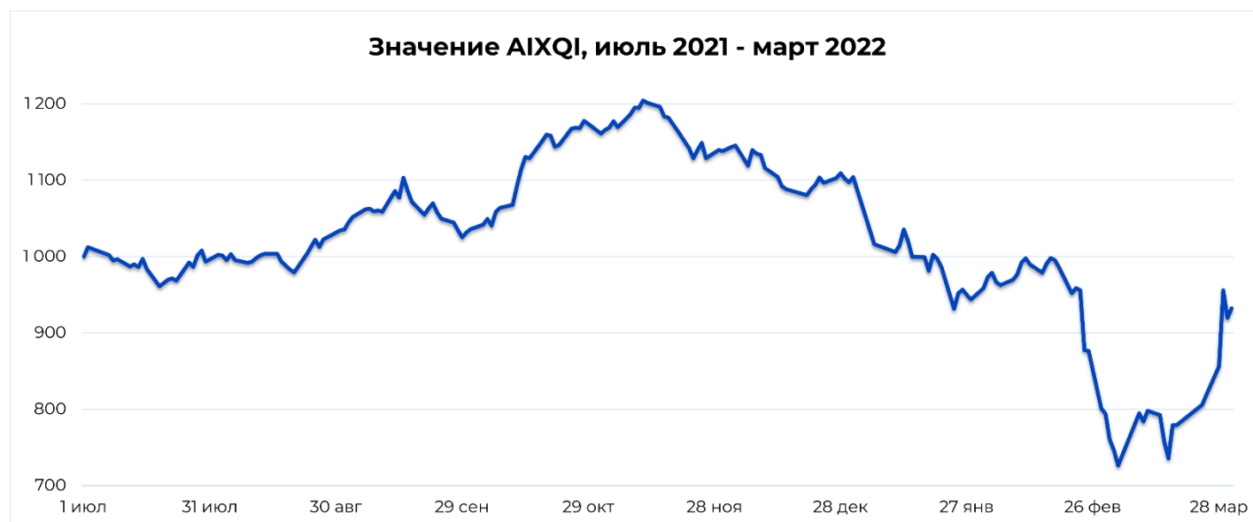
Значение AIXQI, июль 2021 - март 2022

Санкционное давление на Россию продолжает негативно сказываться на котировках Polymetal – в марте и феврале падение составило -13,06% и -65,63% соответственно. В то же время санкции, согласно официальному заявлению компании, не оказали существенного влияния на деятельность компании, которая неукоснительно соблюдает все применимое законодательство и принимает всесторонние меры для соблюдения санкционного режима. В Polymetal считают, что адресные санкции маловероятны, но не исключены. Планирование на случай непредвиденных обстоятельств было инициировано заранее для обеспечения непрерывности бизнеса.